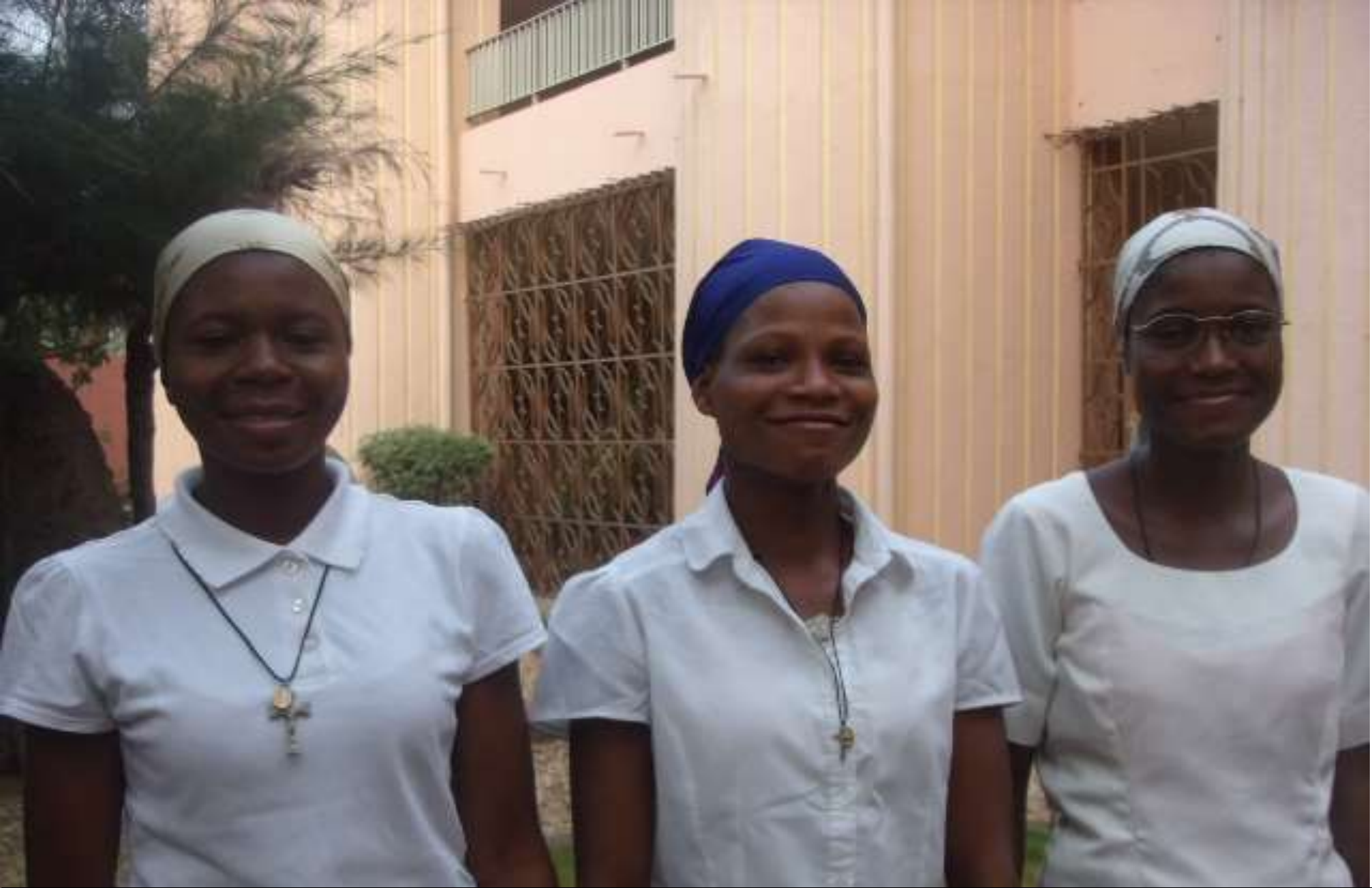
LE FUTUR EST ENTRE LES MAINS DE DIEU - 3 ASPIRANTES